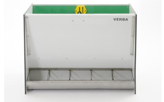
SL573 D KR