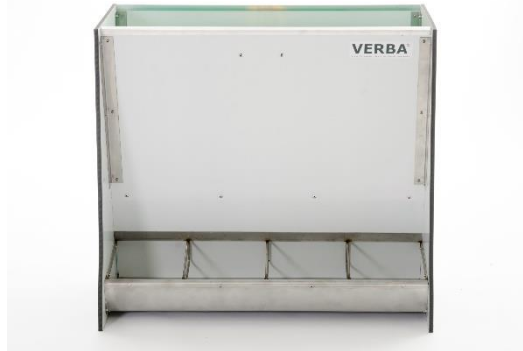
SL 473 KR