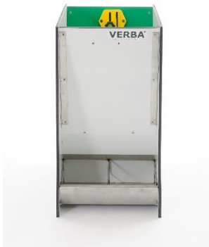
SL 273 D KR